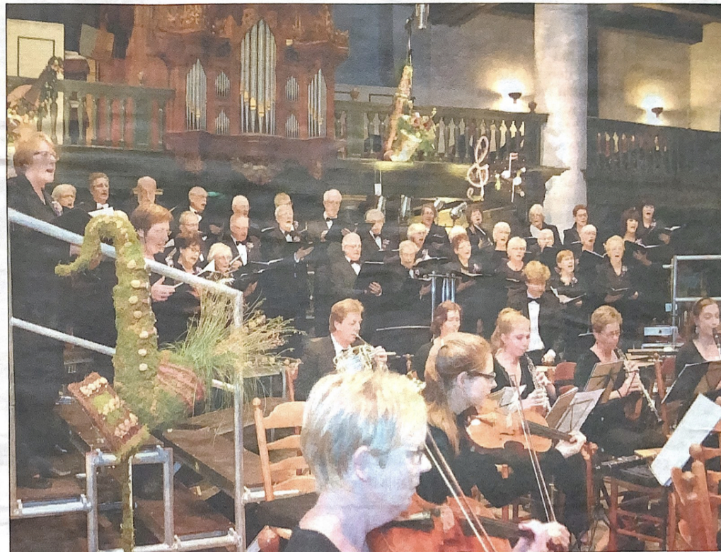
Immanuël in de Grote Kerk.

Prachtig gezongen aria's verbeeldden de muzikale felicitaties voor het jubilerende koor. CGZ Immanuël kan met vertrouwen