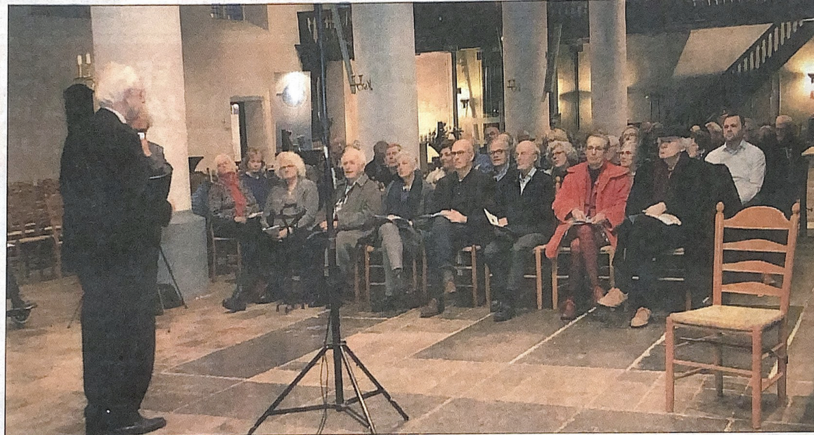
De bezoekers in de Grote Kerk genoten van de première-compositie A Mass Legacy .