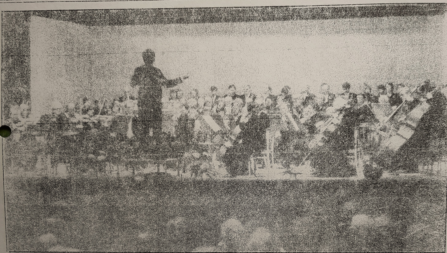
* NFO en Oratoriumvereniging gezamenlijk in actie.